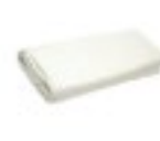
Duk till f llbart bord (BL103)